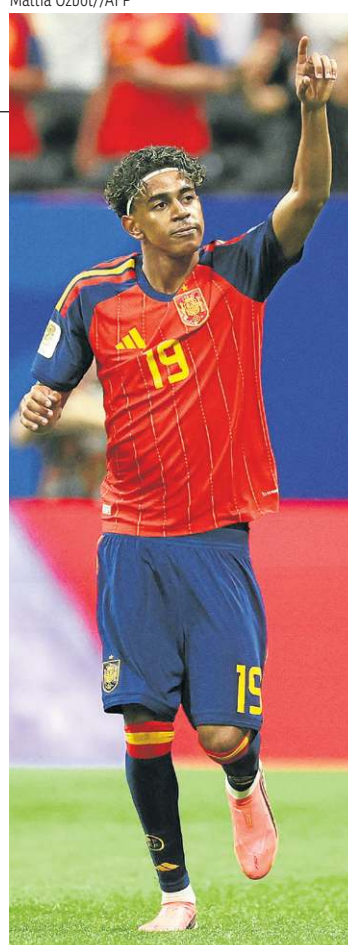
Fenômeno espanhol abriu o placar aos 10 minutos de jogo