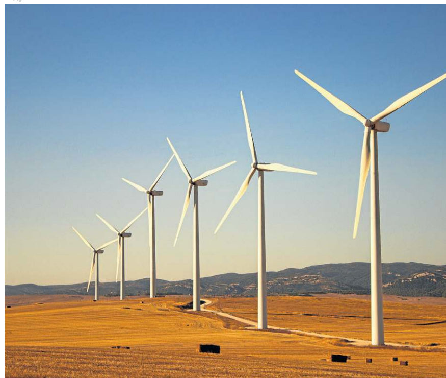
Pesquisa indica a necessidade de ampliar a capacidade de armazenamento

basearmos em médias de custos simples, nosso modelo simula matematicamente as operações horárias e os investimentos em capacidade de uma instalação completa de hidrogênio verde ao longo de uma vida útil de 25 anos.”