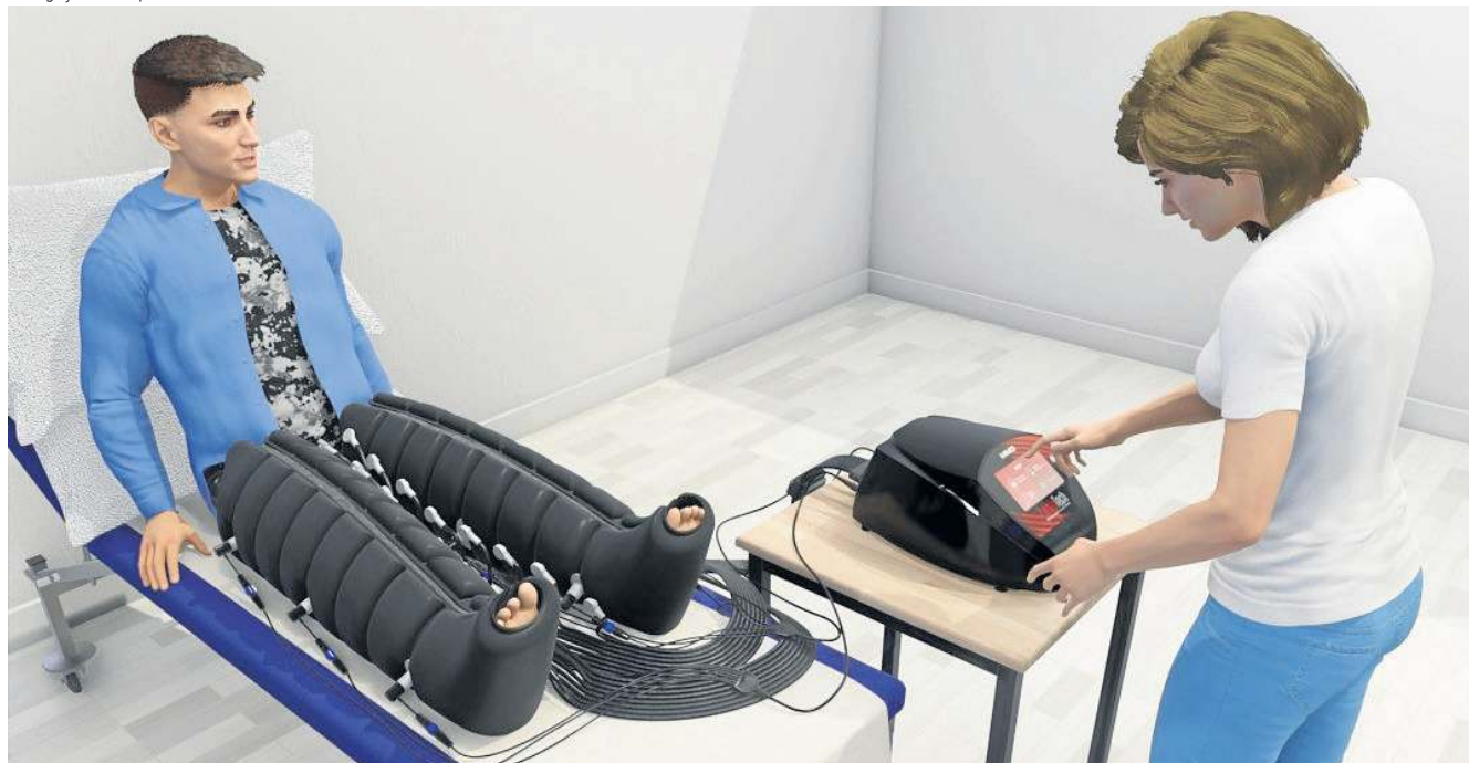
Compressão pneumática e radiação terapêutica em um único equipamento oferecem um protocolo de reabilitação mais rápido