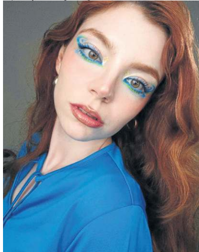
Um delineado azul com um toque mais verde pode fazer um sucesso e tanto