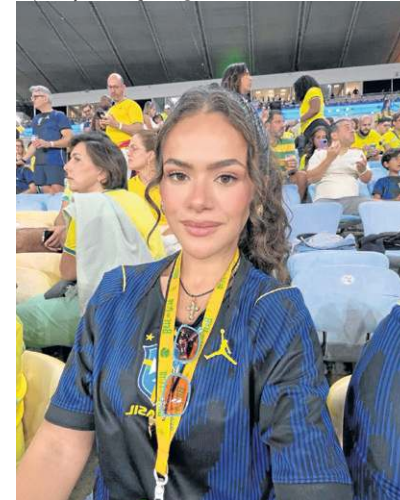
O 'rabo de cavalo' é o prático que sempre funciona, entregando charme e beleza