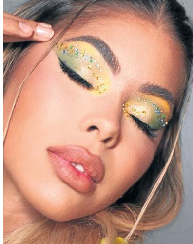
Sombras com as cores do Brasil estão entre as tendências de make