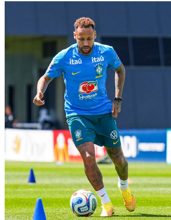
Ontem, atacante fez atividade individual com bola