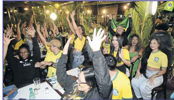
Minervino Junior/CB/D.A Press

...e nos bares espalhados pelas regiões administrativas e pelo Plano Piloto, como no Caju Limão do Sudoeste