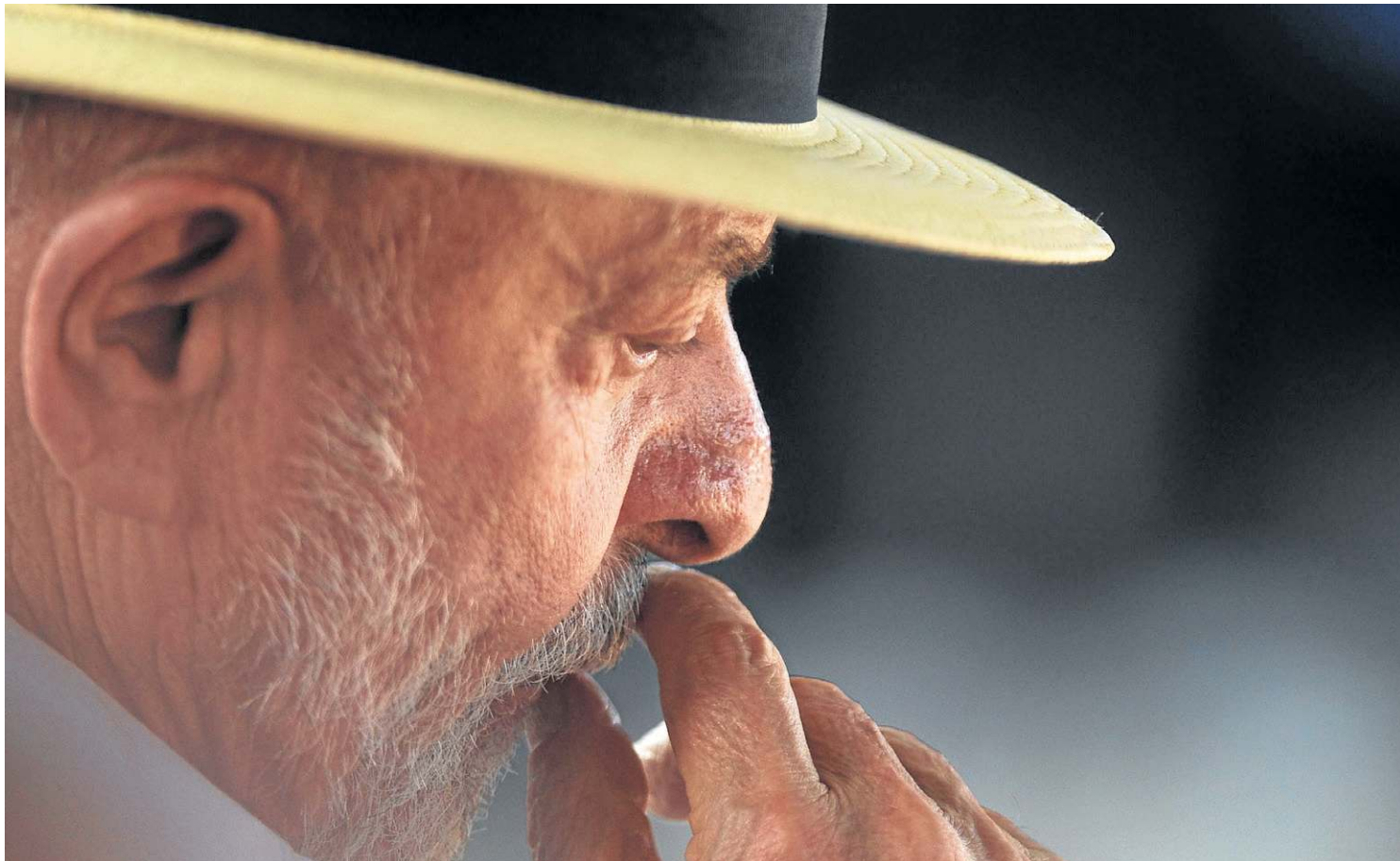
No discurso em Belo Horizonte, o presidente Lula não comentou a operação da Polícia Federal contra o líder do governo no Senado