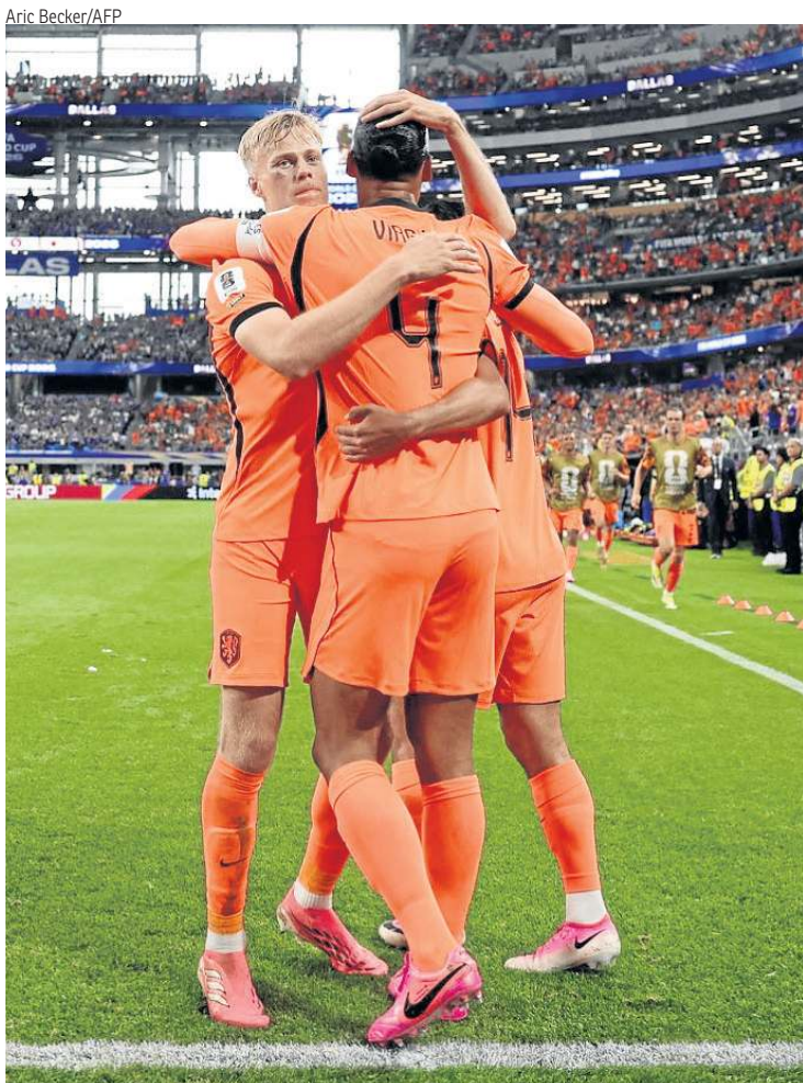
Holandeses querem aproveitar invasão da torcida por recuperação

Dentro de campo, a Suécia também vive motivos para festejar. A goleada por 5 x 1 sobre a Tunísia colocou a seleção na liderança isolada do Grupo F e abriu a possibilidade de uma classificação antecipada ao mata-mata. Uma vitória diante da Holanda deixará os