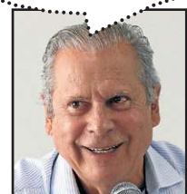
Lula Marques/Liderança PT

Acompanhe a cobertura da política local com @anacampos_cb