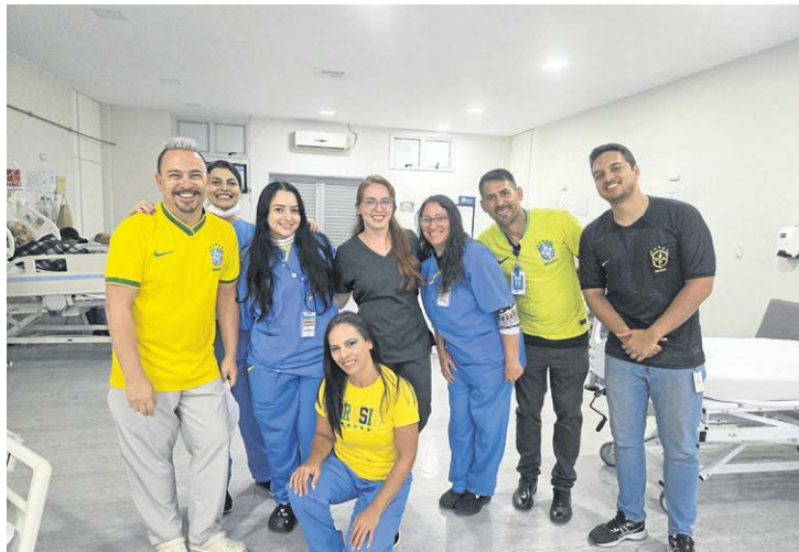
Equipe do Hospital Cidade do Sol montou uma programação lúdica