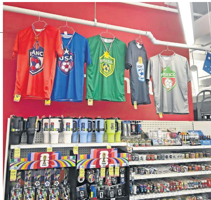
Lojas de departamento e farmácia ofertam itens paralelos do Mundial