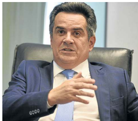
Minervino Júnior/CB/D.A Press