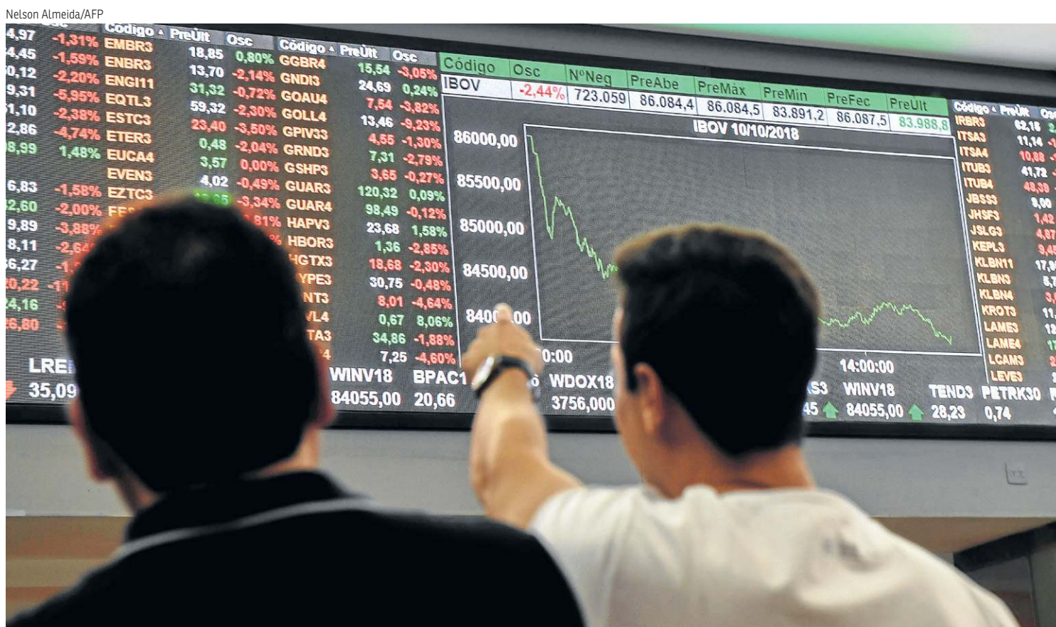
Juros futuros passaram a renovar máximas, ontem, na Bolsa de São Paulo, com alguns contratos de DI para 2029 perto de 15% ao ano

Enquanto isso, no Brasil, após cortar a taxa básica da economia em