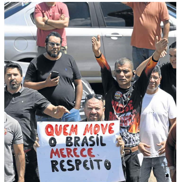
Protesto de motoristas de aplicativos: chance de renovar frota