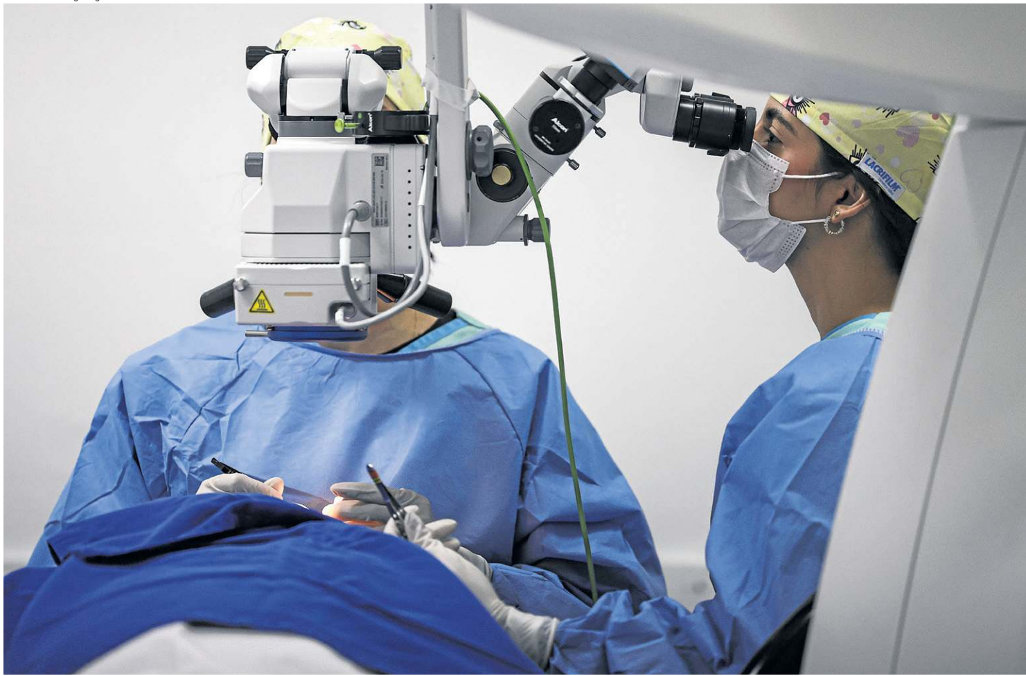
Enamed de 2025 mostrou os problemas na formação médica no país. Exame deste ano aumenta grau de dificuldade para exercer a profissão