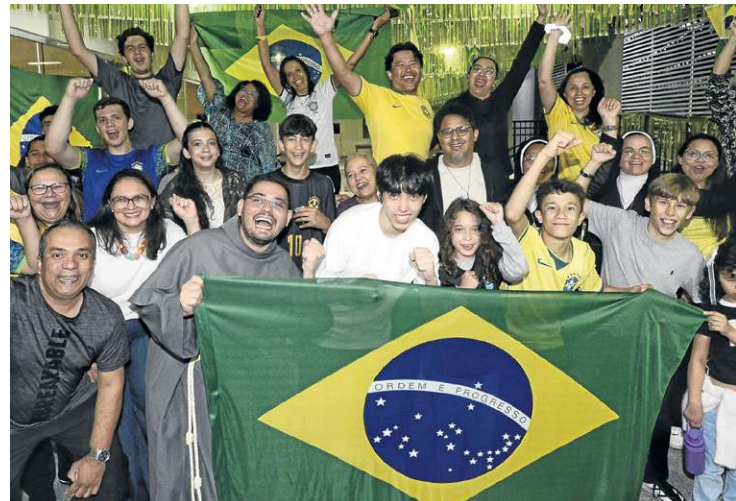
Fiéis e frades se reúnem na Basílica de São Francisco de Assis

as ruas do DF. As vias com maior movimento foram o Eixo Monumental, na altura do Mané Garrincha; o Eixão, na altura da 113 Sul, sentido Guará; a DF-051, no sentido Candangolândia; a EPIA, no sentido Núcleo Bandeirante; e a EPTG, no sentido Vicente Pires e Taguatinga.