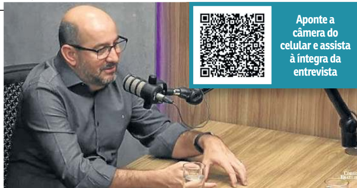
“O futebol pode gerar adesão a uma ideia, mas também pode anestesiar”

de várzea, fundamentais para a popularização da modalidade”, disse.