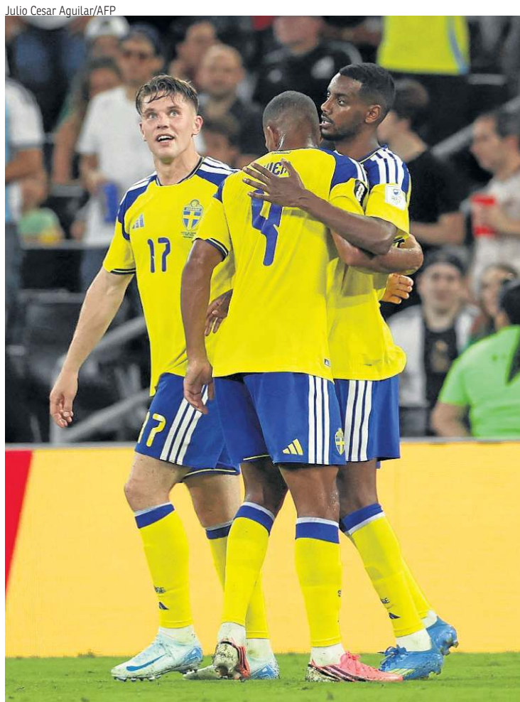
No Midsommar, suecos podem confirmar vaga no mata-mata da Copa