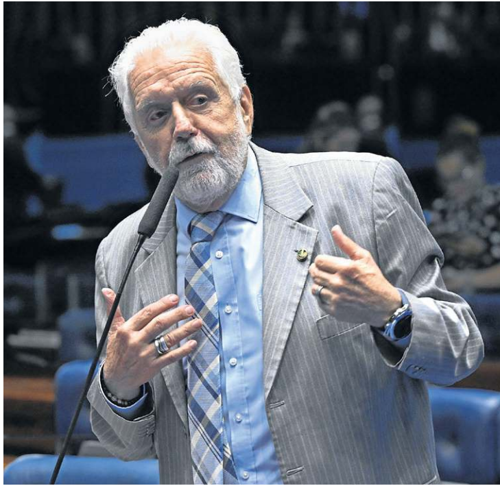
Wagner nega irregularidades e diz que segue líder do governo no Senado