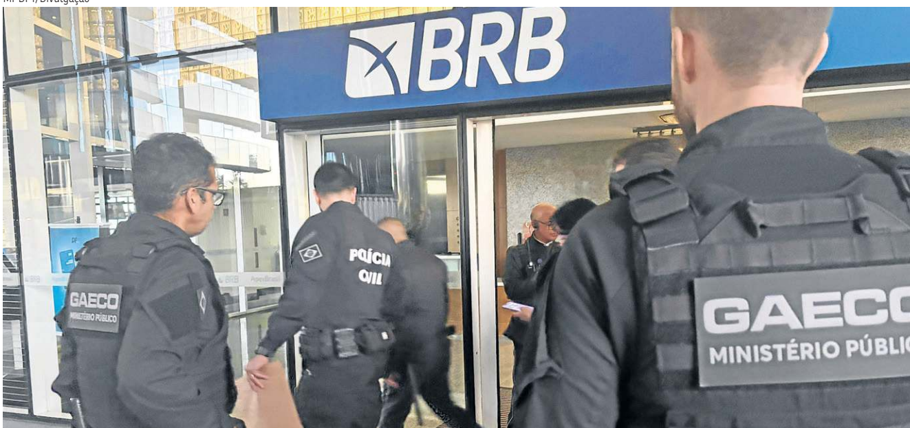
A operação investiga um suposto esquema de descontos na folha de pagamento de servidores do GDF