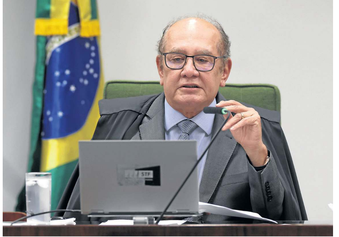
Ministro considerou que os recursos não podiam mais discutir o mérito da decisão da Corte