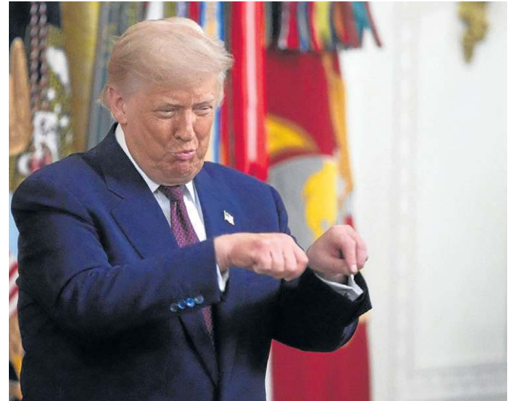
Trump sobre Lula: "Não penso nele. Não poderia me importar menos"

Ao saber dos comentários, o presidente Lula, que participou do encontro como convidado do presidente da França, Emmanuel Macron, rebateu as críticas, ainda na Europa, antes de voltar ao Brasil. "Acho que ele (Trump) tem direito de ter as preferências eleitorais dele, as preferências ideológicas dele. Eu só espero que ele não fira o código de ética entre as nações que querem ser respeitadas na sua soberania. Para mim, ele pode continuar gostando do Bolsonaro, do pai, do filho, do neto — não tem nenhum problema. Agora, não se meta nas eleições do Brasil, porque as eleições do Brasil são um problema do Brasil, assim como as eleições americanas são um problema deles", avisou. Até o fechamento desta edição, Lula não havia se manifestado sobre as novas críticas do chefe de Estado americano.