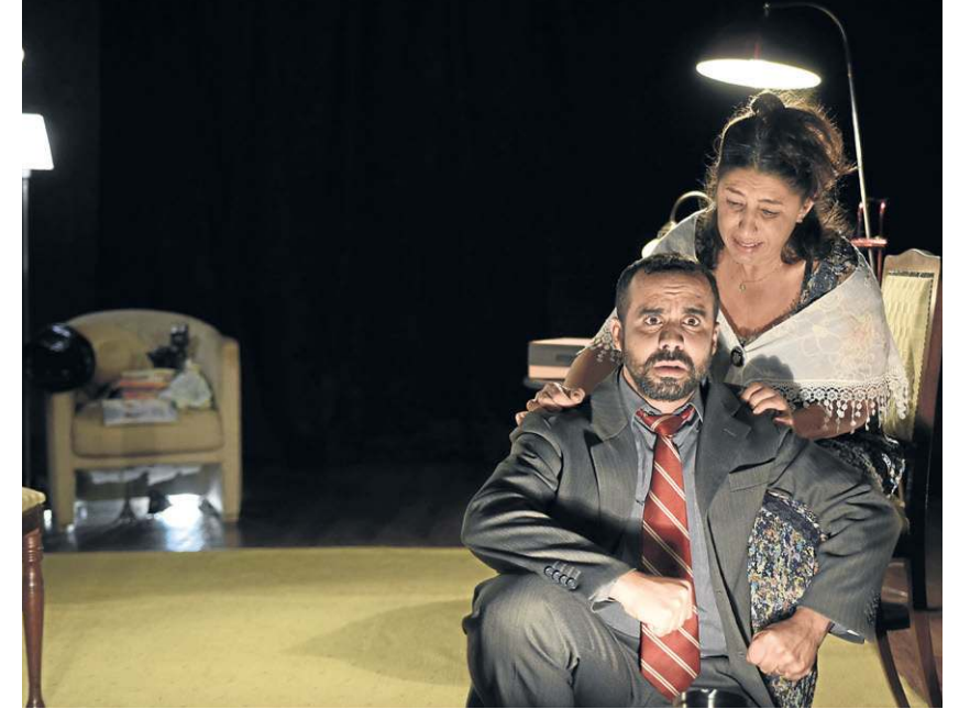
Dicionário das coisas que nunca existiram: desconexão com a realidade