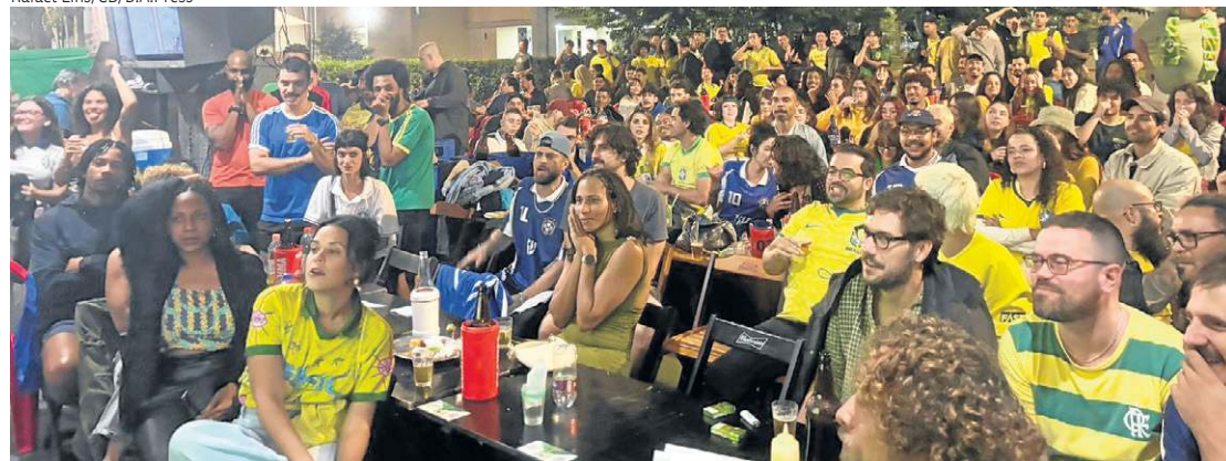
Bar de Mendes, na 410 Norte, reuniu mais de 300 torcedores que, atentos, não perdiam nenhum lance