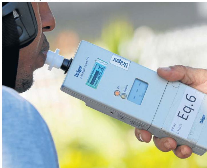
Mortes em 2024 lançam dúvidas a respeito da perda de força da Lei

sucesso no mundo. Mas, sozinha, ela não consegue produzir todos os resultados que a gente espera", salienta.