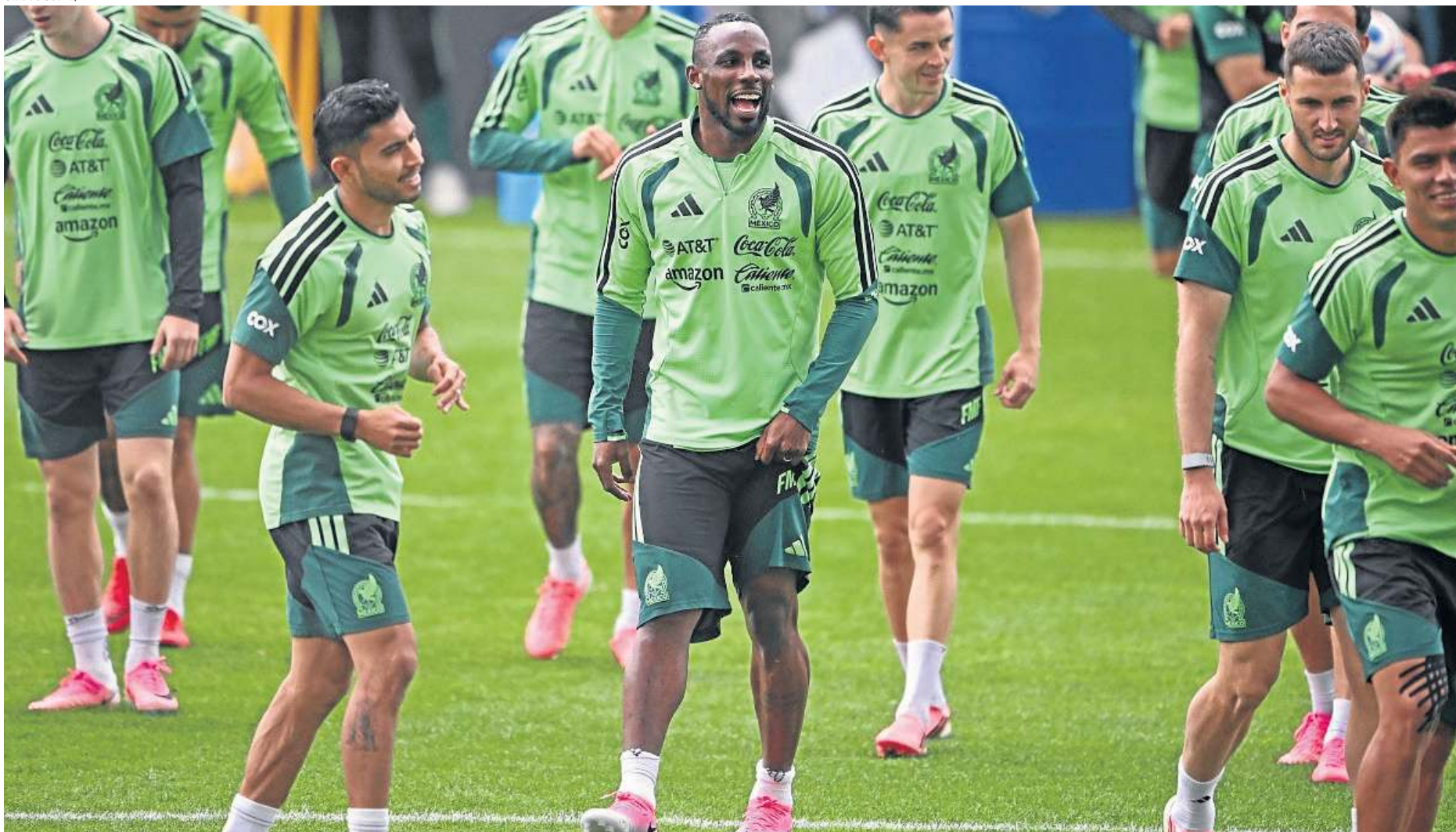
Mexicanos apostam no "fator casa" para carimbarem o passaporte à fase eliminatória da Copa do Mundo de maneira antecipada. Vitória, hoje, contra a Coreia do Sul deixa objetivo próximo

Anfitriões da Copa do Mundo, México e Canadá vão disputar hoje, a segunda rodada dos Grupos A e B do torneio. Enquanto a equipe liderada pelo técnico Raúl Aguirre pega a Coreia do Sul, às 22h, os canadenses entram em campo mais cedo, às 19h, contra o Catar. No radar, a oportunidade de garantir, ou encaminhar, a vaga antecipada.