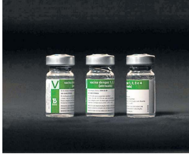
Butantan-DV apresentou reações e será escrutinada por especialistas

relatórios técnicos, a solicitação de informações adicionais ao fabricante e a consulta a bancos