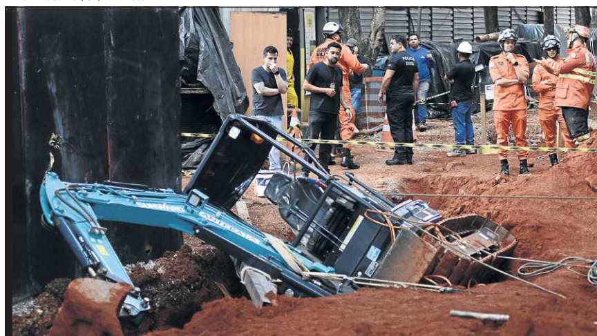
Minervino Júnior/CB/D.A Press