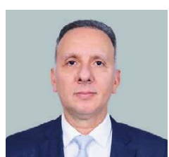
AGUINALDO RIBEIRO DEPUTADO FEDERAL (PP-PB) RELATOR DO PROJETO DE INTELIGÊNCIA ARTIFICIAL DA CÂMARA DOS DEPUTADOS