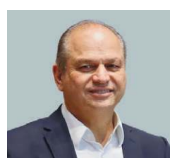
RICARDO BARROS DEPUTADO FEDERAL (PP-PR) TITULAR DA COMISSÃO DE CIÊNCIA, TECNOLOGIA E INOVAÇÃO DA CÂMARA DOS DEPUTADOS