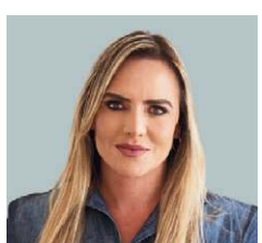
CELINA LEÃO GOVERNADORA DO DISTRITO FEDERAL