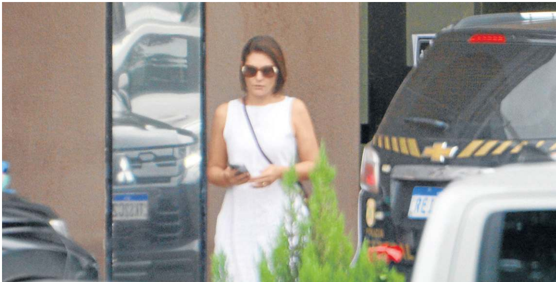
A ex-primeira-dama Michelle Bolsonaro deve lançar candidatura a uma vaga no Senado pelo DF