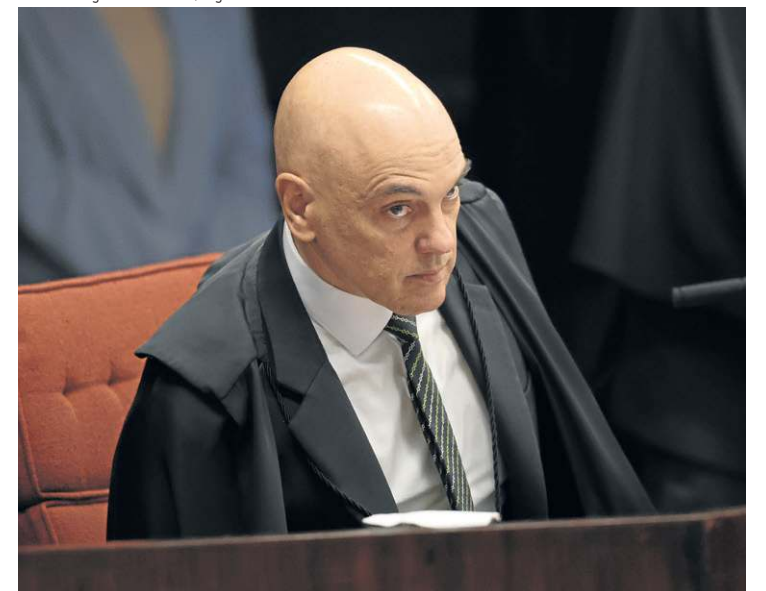
Duas redes sociais processam Moraes em tribunal da Flórida