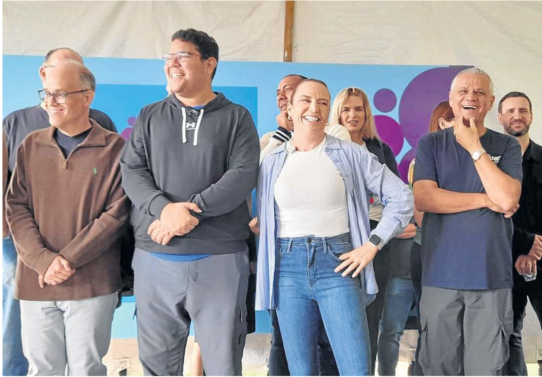
Em Águas Claras, Celina assinou decretos relacionados ao meio ambiente

Durante a Caminhada Ecológica do Meio Ambiente 2026, ontem, no Parque Ecológico de Águas Claras, a governadora Celina Leão (PP) assinou uma série de medidas voltadas à sustentabilidade, ao turismo ecológico e à preservação hídrica no Distrito Federal. O evento também instituiu o Dia da Caminhada nas Trilhas Ecológicas do DF.