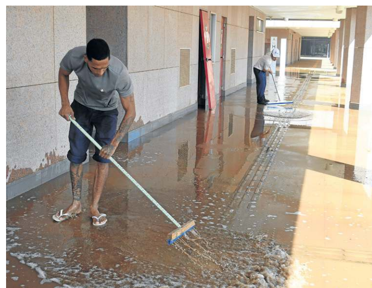
Prédios passam por uma força-tarefa de recuperação

Para ele, apesar de bem-vinda, a ocupação do centro administrativo chega com atraso, mas está alinhada a uma transformação que vem ocorrendo no Distrito Federal. "Houve uma pseudoinauguração em 2014, mas nunca a efetiva ocupação daquele espaço. A mudança é positiva porque direciona movimentos da cidade para outras regiões