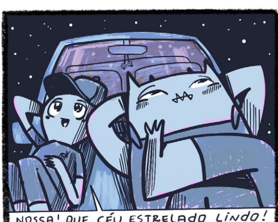
NOSSA! QUE CÉU ESTRELADO LINDO!