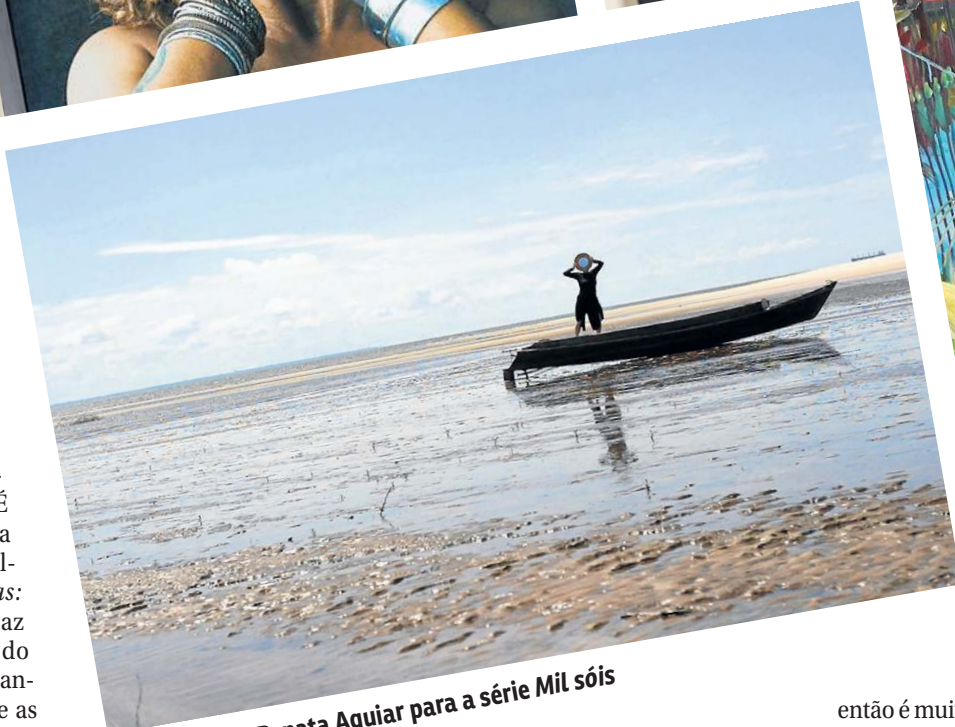
Fotografia de Renata Aguiar para a série Mil sóis

Curadoria: Sissa Aneleh. Visitação até 16 de agosto, de terça a domingo, das 9h às 21h, na Galeria 1 do CCBB (Setor de Clubes Especial Sul Trecho 2 - Plano Piloto)