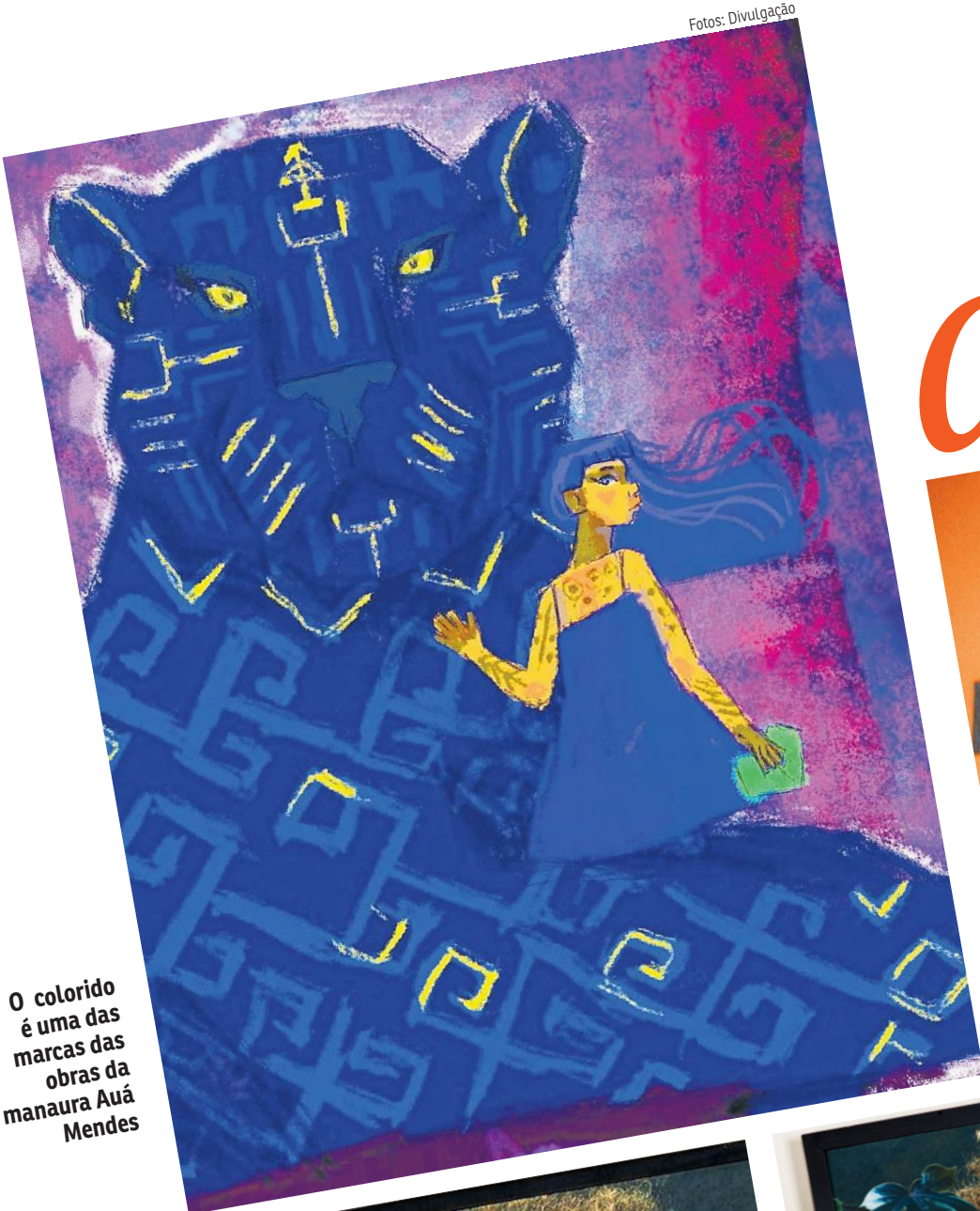
O colorido é uma das marcas das obras da manaua Auá Mendes