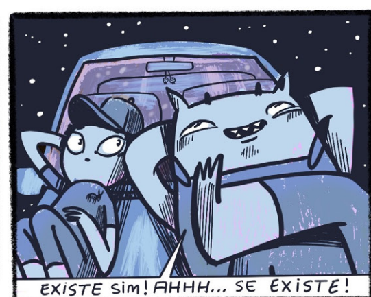
EXISTE SIM! AH... SE EXISTE!