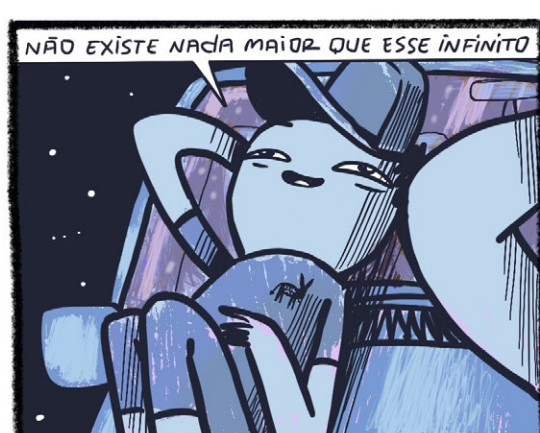
NÃO EXISTE NADA MAIOR QUE ESSE INFINITO