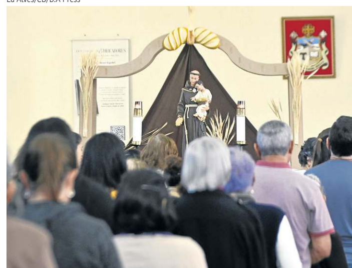
Cerca de 30 mil fiéis passaram pelo santuário ontem