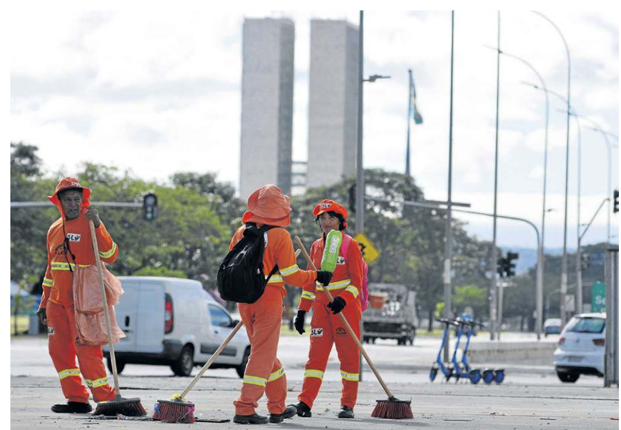
Segundo o secretário, a zeladoria da capital não será afetada

Fomentos, festas, patrocínios esportivos, eventos culturais e sociais, contratos de terceirização.