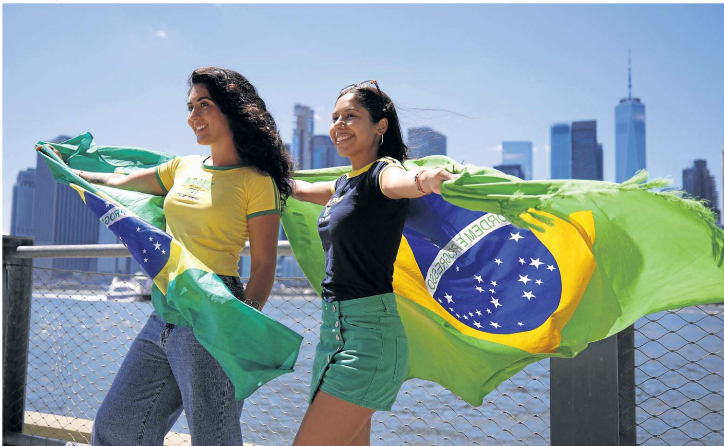
Torcedoras com a camisa e bandeira do Brasil na fan zone do Brooklyn, em Nova York: símbolos nacionais em disputa

A camisa amarela da Seleção Brasileira voltou às ruas, vitrines, bares e academias. Em ano de Copa do Mundo, a cena parece corriqueira. Mas, no Brasil de 2026, ela tem um significado que vai além do futebol. Em 2022, o verde e amarelo se tornaram símbolos fortemente associados ao bolsonarismo, a ponto de parte dos brasileiros evitar vestir a camisa da Seleção por receio de ser identificada politicamente. Quatro anos depois, o torneio mundial impulsiona o retorno dessas cores ao espaço público e reacende o debate sobre o significado dos símbolos nacionais em um cenário menos marcado pela exclusividade política observada nos últimos anos.