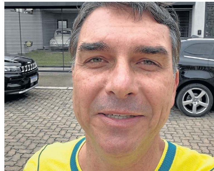
Flávio ressaltou o apoio do pai ao escrete brasileiro: “Na torcida”

harmonia do time. Eles têm que estar bem (...) e jogar pensando no povo brasileiro”. O presidente também destacou a representatividade, lembrando que os