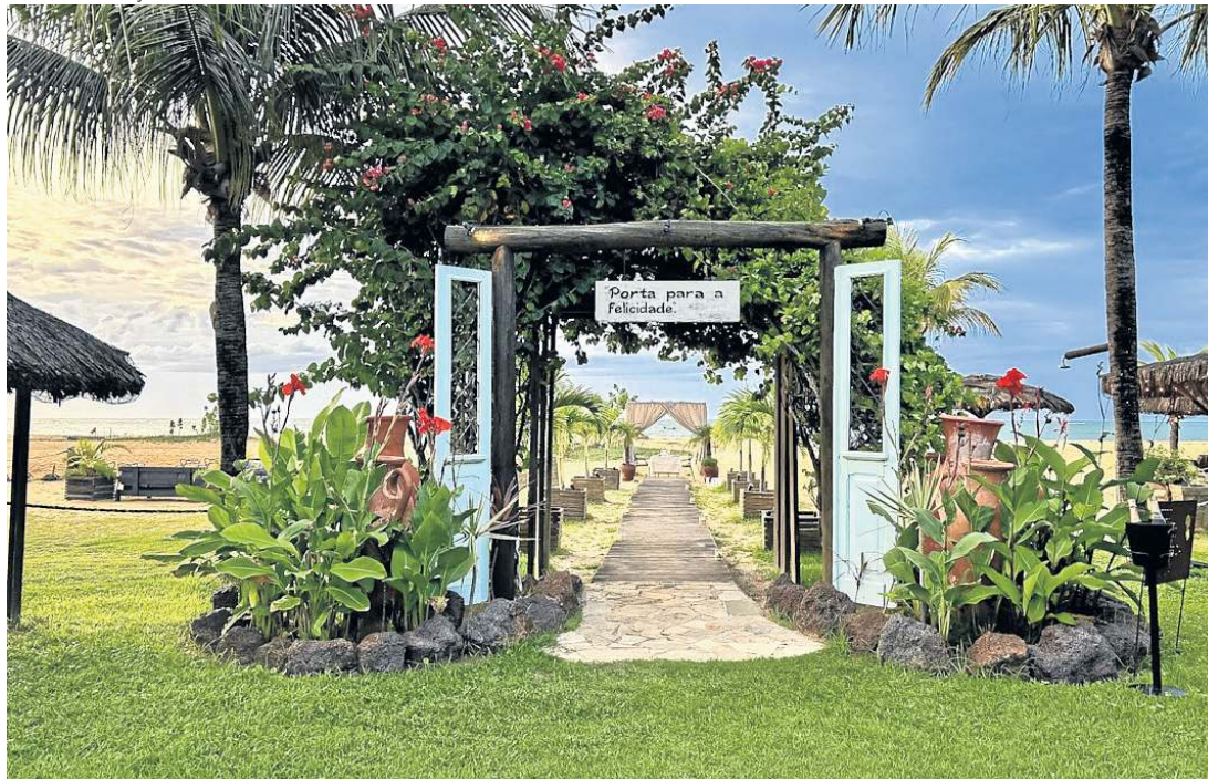
O caminho que conduz ao Hotel Mi Secreto antecipa a experiência de exclusividade e o refúgio cercado de natureza que a hospedagem oferece