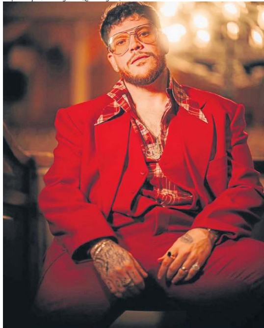
Especialistas alertam para óculos com lentes coloridas nas saídas noturnas