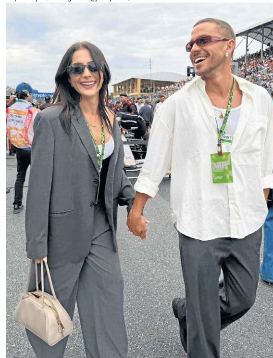
Esse acessório é prático e comum para o dia a dia