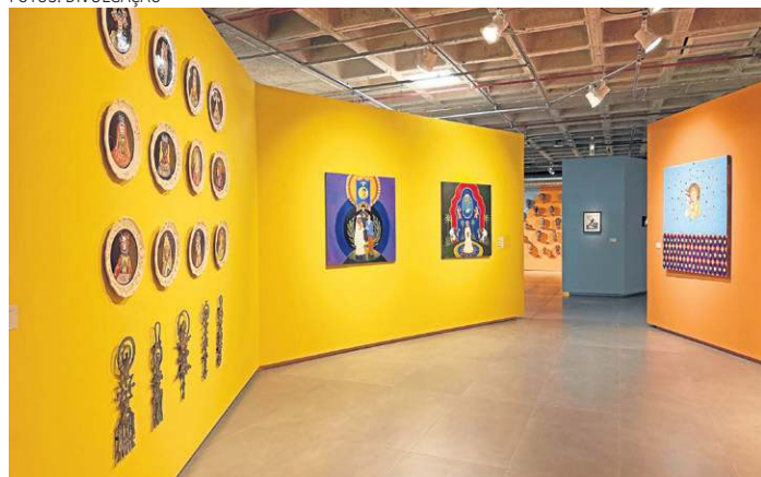
A mostra coletiva reúne obras de diversas regiões e gerações