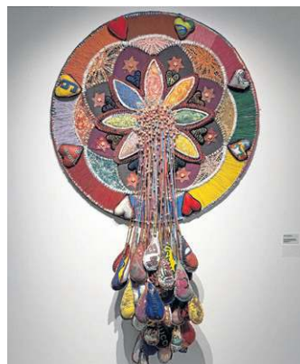
Obra de Marcos Cardoso feita com fios