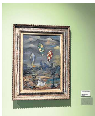
Pintura de Alberto da Veiga Guignard: referência às festas

surgiu porque, embora a gente tenha o carnaval, que é a grande festa brasileira, aquela festa que tem em tudo que é cidade do Brasil é a festa junina”, explica o curador. “Tem do Recife até Araripina, você vai numa biboca de 20 mil habitantes e tem uma festa junina. É a grande festa de congraçamento, de referência de um Brasil mais harmônico, e o interessante é criar um diálogo sobre essa questão das influências, da diversidade”.