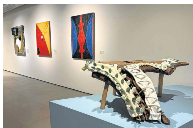
Esculturas e pinturas fazem parte do acervo apresentado