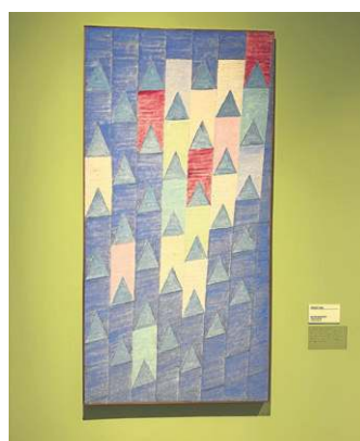
Alfredo Volpi e as tradicionais bandeirinhas