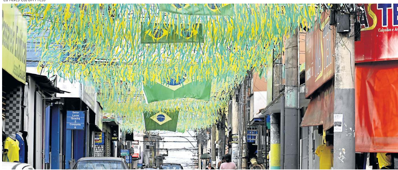
A decoração na Estrutural alimenta o sonho das crianças de também se tornarem jogadores de futebol