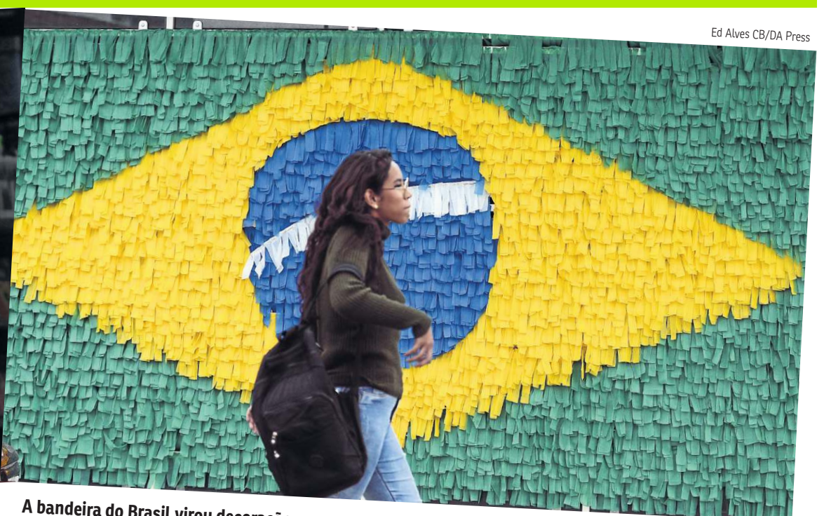
A bandeira do Brasil virou decoração nos muros do Gama, a dois dias da estreia do Brasil na Copa

Após perder força durante a pandemia, tradição de pintar e decorar as ruas para o Mundial renasce no Distrito Federal, reunindo gerações e formando verdadeiras galerias a céu aberto