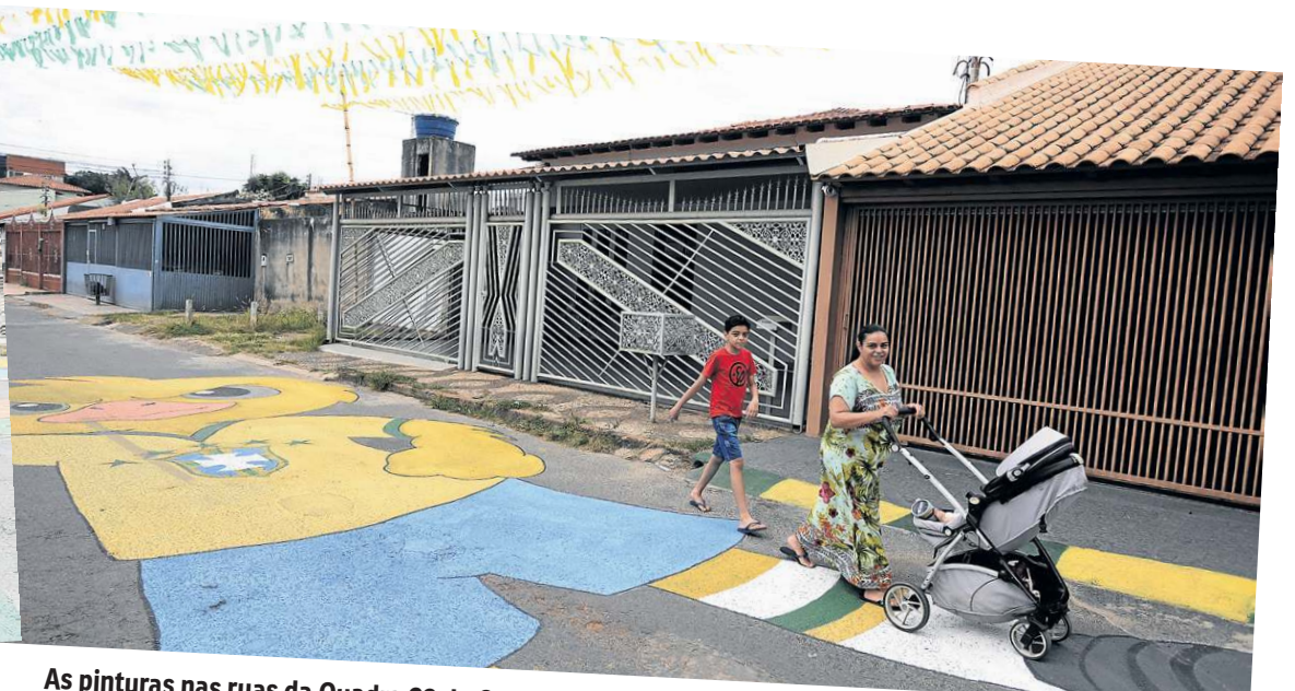
As pinturas nas ruas da Quadra 22 do Gama são feitas durante a madrugada