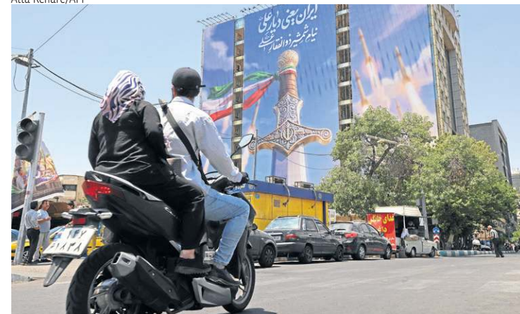
Cartaz em Teerã mostra mísseis e uma espada: desafio a Trump

A nova escalada no Oriente Médio provocou apelos por moderação da parte da Rússia e da China, aliadas do Irã. "Estamos extremamente preocupados com a nova rodada