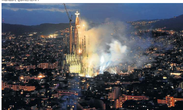
Espetáculo pirotécnico ao redor da igreja marca o fim da visita