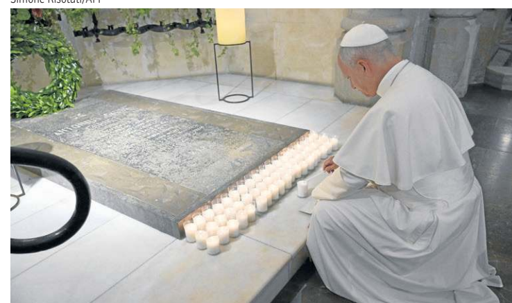
O pontífice acende uma vela diante do túmulo de Antoni Gaudí