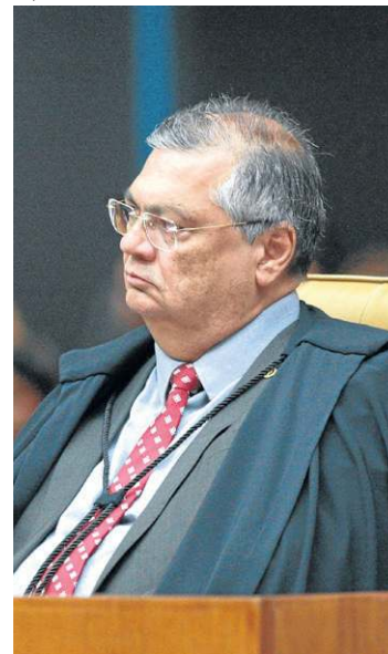
O ministro Flávio Dino fixou multa de 1% do valor da emenda