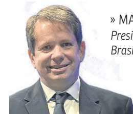
» MARCO LA PORTA Presidente do Comitê Olímpico do Brasil (COB)

Quando um brasileiro sobe ao pódio olímpico, o país inteiro comemora. A medalha aparece na televisão, ocupa as redes sociais, emociona famílias e inspira milhões de jovens. Mas existe algo que nem sempre aparece nesse momento: a grande estrutura que existe por trás de cada conquista. Nenhum resultado esportivo nasce apenas do talento individual. Ele nasce de investimento, planejamento, formação, oportunidade e, principalmente, continuidade.