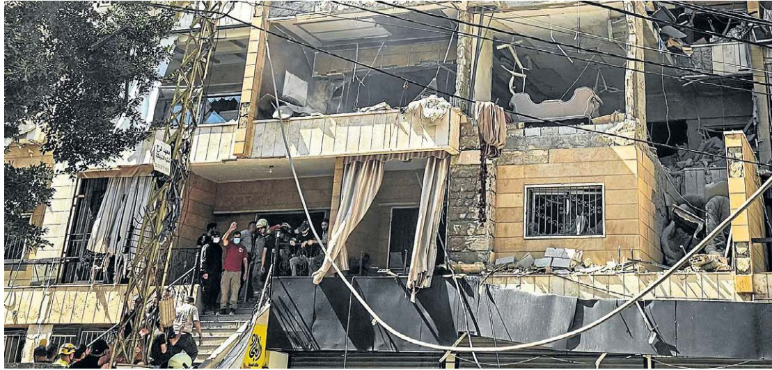
Fachada de prédio danificada por bombas de Israel no sul de Beirute, em área dominada pelo Hezbollah

preparam uma “resposta poderosa” à agressão. Também em Haifa, uma idosa de 79 anos ficou ferida em um dos ataques ao tentar