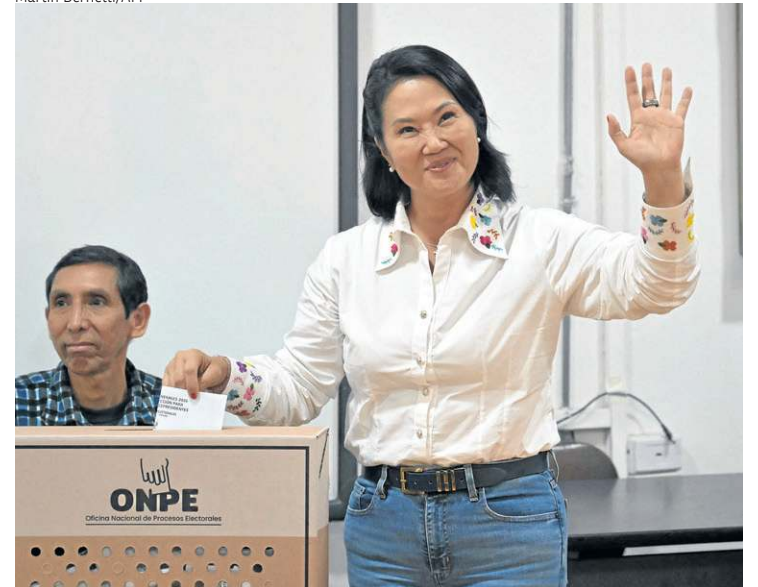
A direita Keiko Fujimori, ao votar em seção eleitoral de Lima