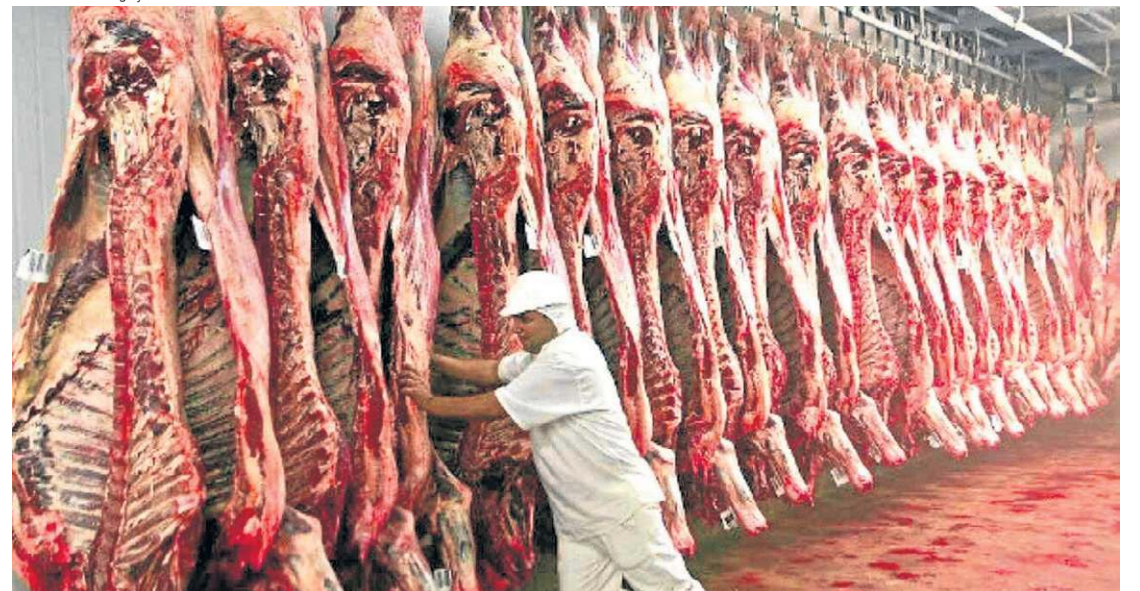
Medida entra em vigor em 3 de setembro; exportações de carnes à UE somaram US$ 1,8 bilhão em 2025