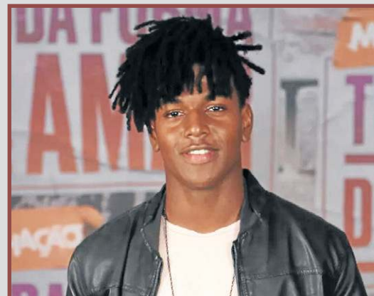
A fama veio como Camelo em Malhação