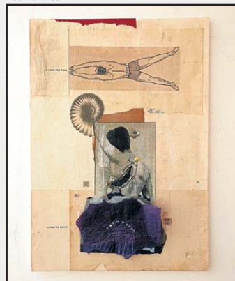
As colagens de Léo Tavares fazem parte da exposição