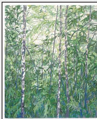
Pintura de Fernando Leite explora temas da natureza