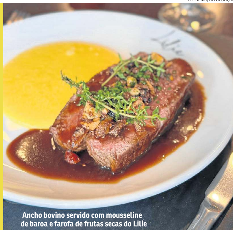
Ancho bovino servido com mousseline de baroa e farofa de frutas secas do Lilie

Para iniciar, a entrada é uma salada fresca acompanhada de queijo de cabra, pistache e vinagrete de framboesa. O restaurante selecionou duas opções de prato principal: o risoto de camarão com tomate concassé e manjerição ou o ancho bovino, servido com mousseline de baroa e farofa de frutas secas. Para a sobremesa, a casa aposta em um fondue de chocolate com frutas frescas servido no pão, especialidade da casa.