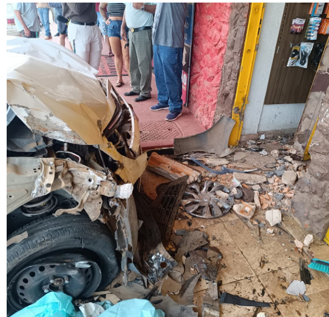
Veículo atingiu a vítima, atirando-a na calçada comercial

em frente a um posto de combustíveis, no sentido Valparaíso de Goiás. No local, os socorristas encontraram uma mulher caída sobre a pista, em parada cardiorrespiratória e com traumatismo cranioencefálico grave. A vítima não resistiu aos ferimentos e teve o óbito constatado ainda na via. Pouco depois, outro atropelamento fatal foi registrado na região da Estância Mestre D'Armas, em Planaltina. Segundo o CBMDF, a vítima, um homem, estava sem sinais vitais quando os bombeiros chegaram. O motorista fugiu.