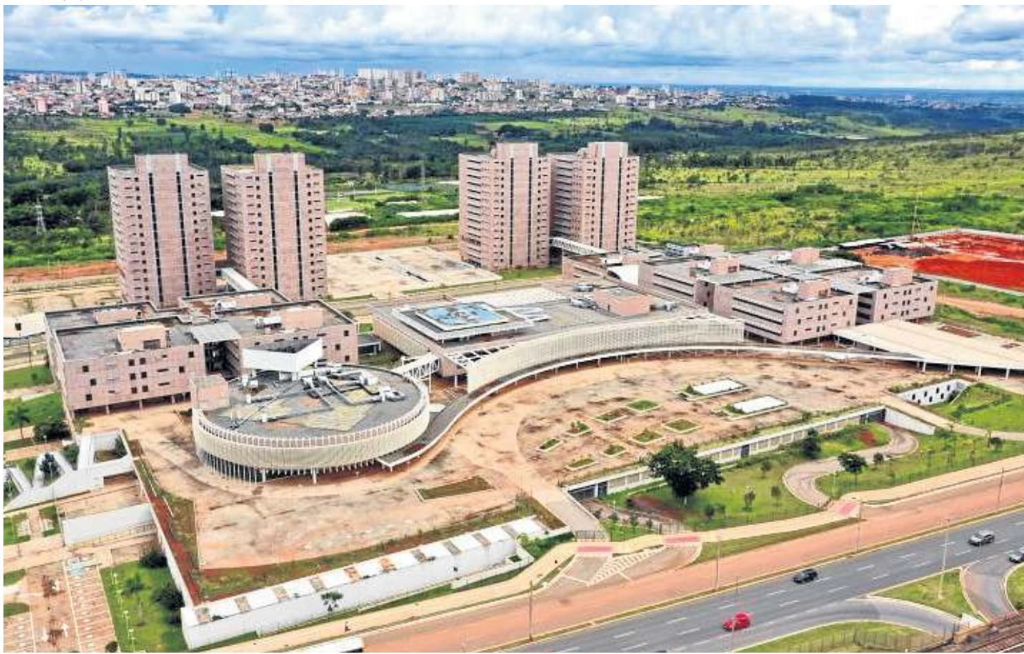
Complexo entre Taguatinga, Ceilândia e Samambaia tem área de cerca de 25 campos de futebol e foi inaugurado em 2014, mas nunca ocupado