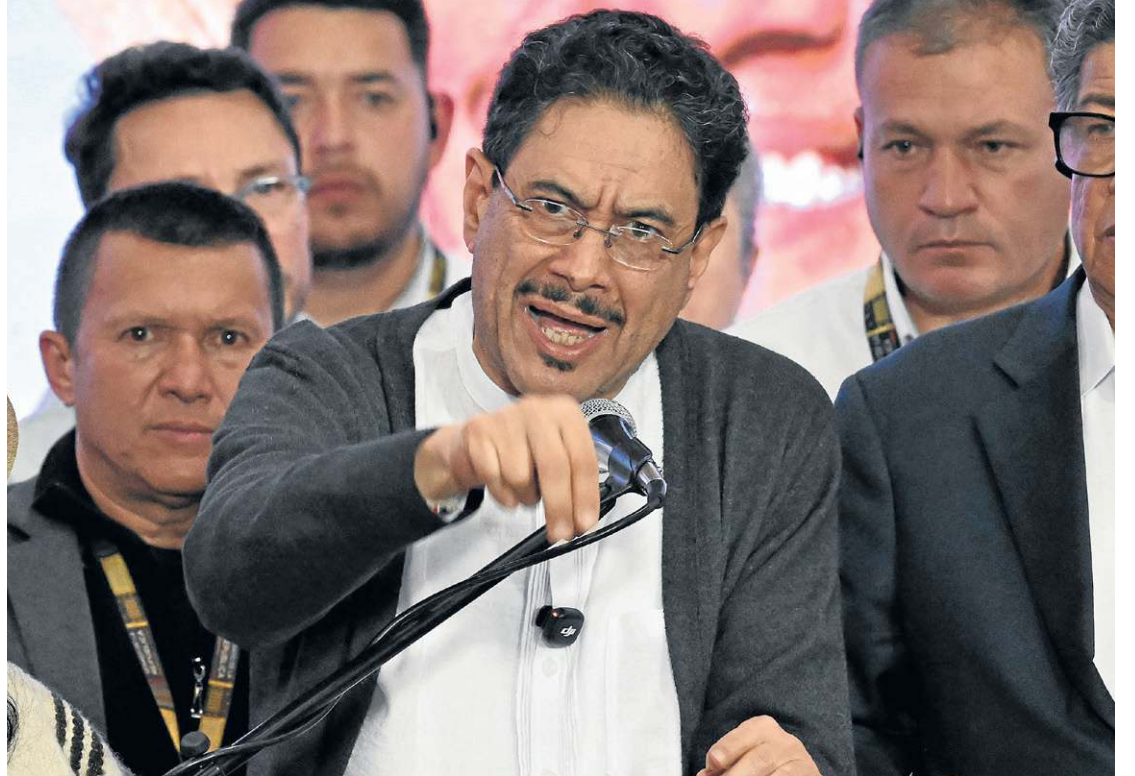
Iván Cepeda, candidato da esquerda, fala aos simpatizantes em Bogotá: resultado frustrante