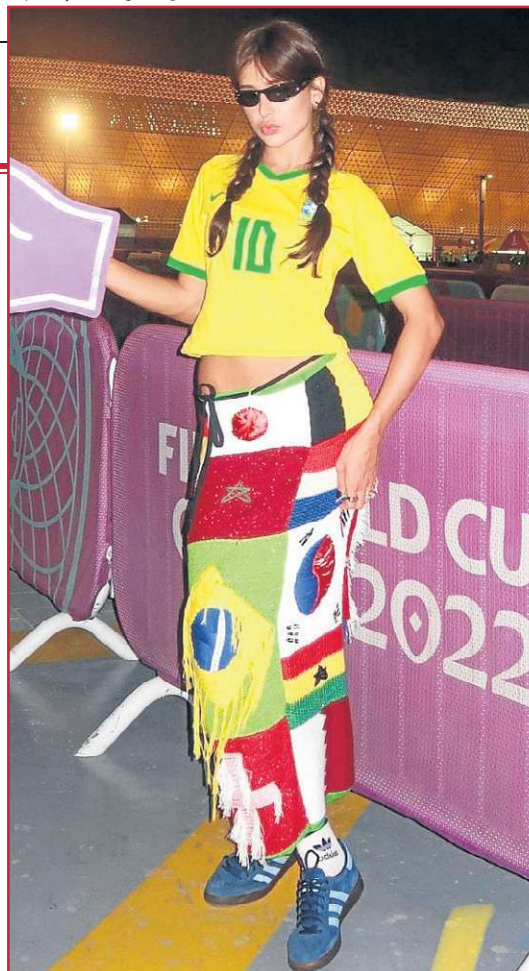
Saias decoradas ajudam a criar combinações fashionistas para assistir aos jogos