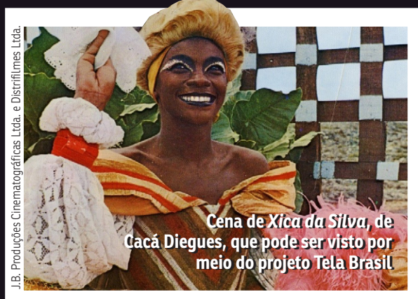
J.B. Produções Cinematográficas Ltda. e Distribuidores Ltda.

A Tela Brasil amplia o acesso da população ao patrimônio audiovisual nacional ao reunir, em um único ambiente público e gratuito, obras produzidas entre 1910 e 2025, representativas da diversidade cultural brasileira. Além de preservar a memória do cinema e do audiovisual do país, a plataforma fortalece a circulação de produções nacionais, promove o reconhecimento de diferentes identidades, territórios e expressões culturais e contribui para a formação de público. Ao disponibilizar gratuitamente conteúdos históricos e contemporâneos, a iniciativa reafirma a cultura como um direito de cidadania e valoriza a produção audiovisual brasileira como parte fundamental.