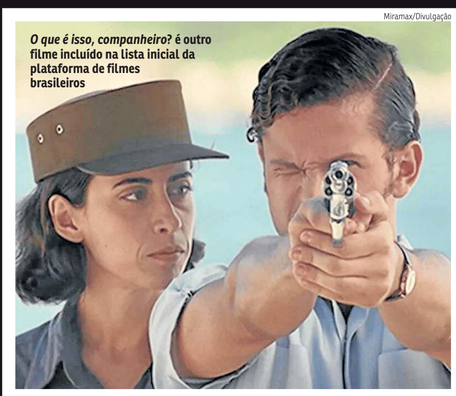
O que é isso, companheiro? é outro filme incluído na lista inicial da plataforma de filmes brasileiros