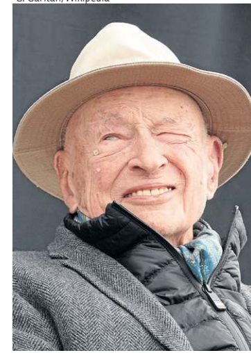
Edgar Morin escreveu 60 livros e desenvolveu o conceito do pensamento complexo