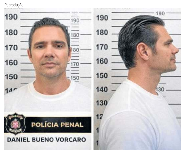
Ex-banqueiro prometeu aos investigadores da PF apresentar fatos inéditos