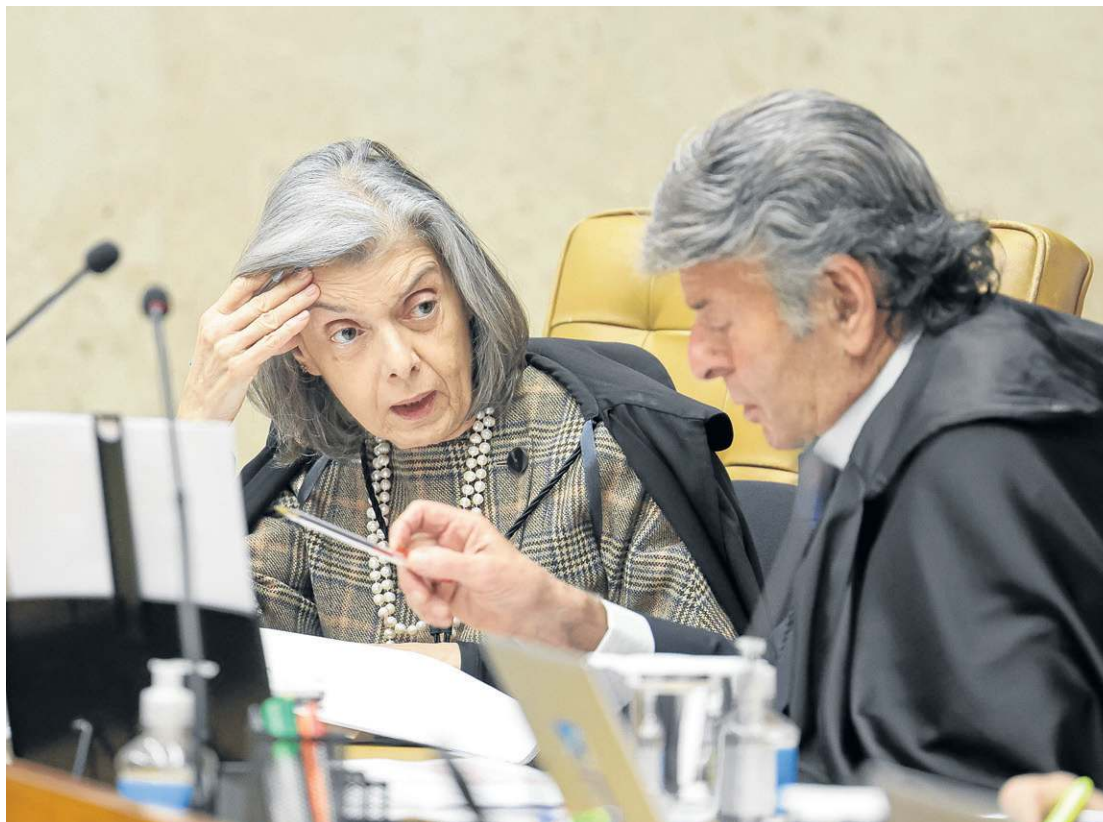
Cármen Lúcia e Luiz Fux manifestaram-se pela ilegalidade que o Congresso promoveu na lei e que Lula sancionou

as mudanças esvaziam a legislação sobre o tema e representam um retrocesso. Para a ministra, a alteração do prazo “esvazia a proteção constitucional à probidade administrativa e à moralidade”, “desguarnecendo o eleitor da salvaguarda da lisura das candidaturas apresentadas”. Presidente do TSE até 12 de maio, a magistrada sustenta que a nova norma “importaria em impunidade ou anistia”, prejudicando o processo eleitoral.