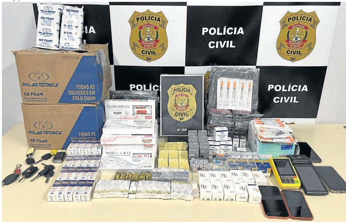
A carga tinha como destino o estado de Minas Gerais; cinco pessoas foram presas