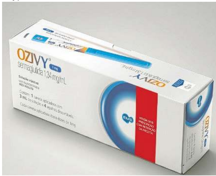
Desenvolvido para a diabetes, a Ozivy promete ter preço competitivo