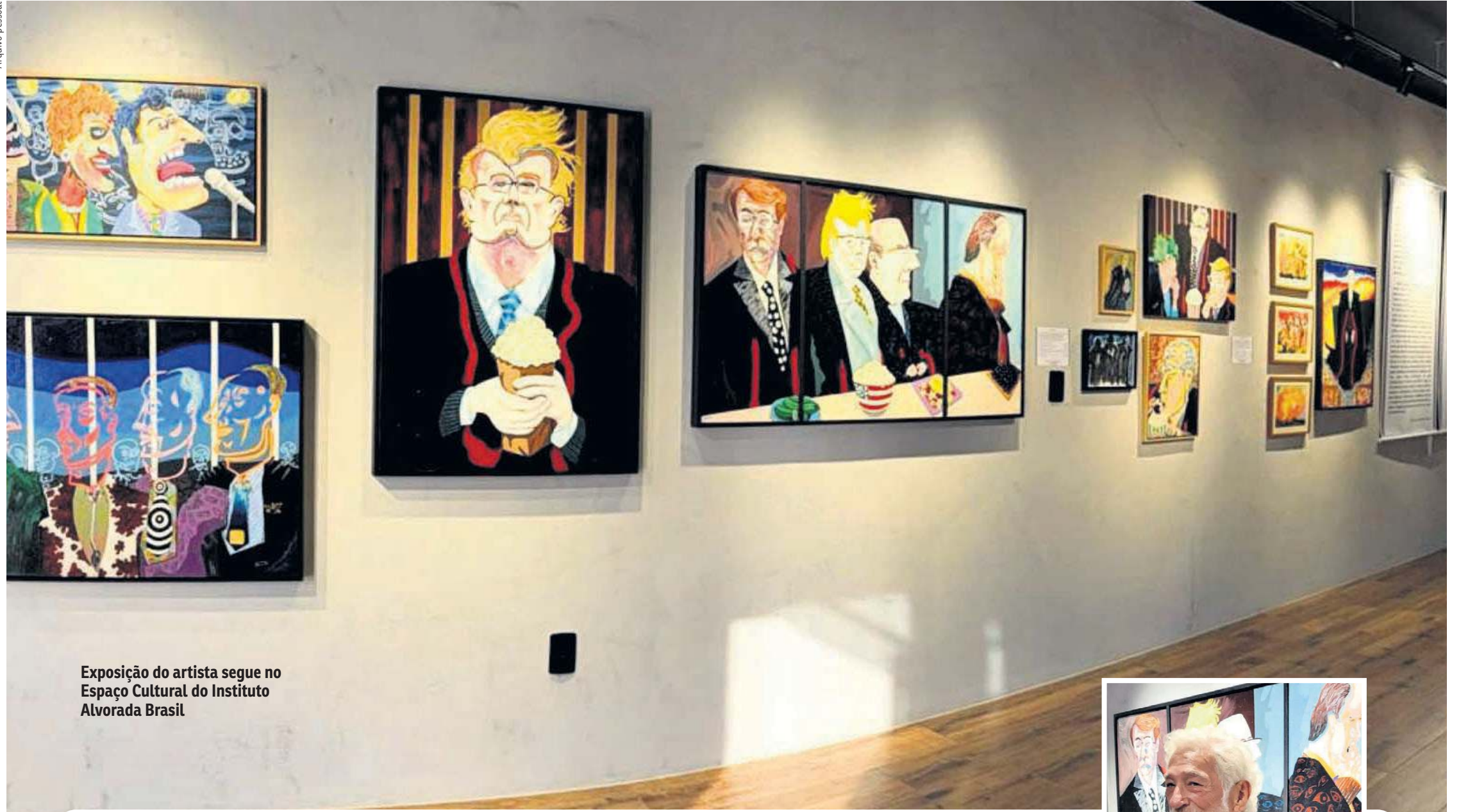
Exposição do artista segue no Espaço Cultural do Instituto Alvorada Brasil