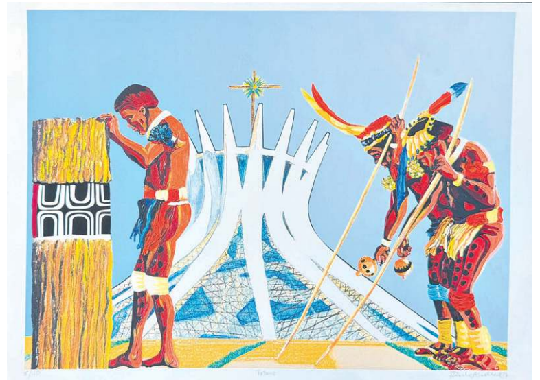
O mestre fez de Brasília uma metáfora

a cena cultural brasiliense nos anos 1970 com cartazes emblemáticos das ocupações que levam a sua assinatura. Também são dele as famosas serigrafias que imortalizaram o cotidiano do Beirute, querido bar da capital federal. Como programador visual de excelência, atuou intensamente no mercado editorial, ilustrando jornais, revistas e livros. E fez, ainda, alguns trabalhos gráficos para a Unesco, como cartilhas informativas sobre a HIV.