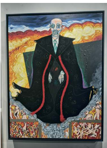
Alexandre de Moraes retratado pelo mestre

e cultural quanto aos valores brasileiros, ilustrando indígenas gigantes que transitam pela cidade.