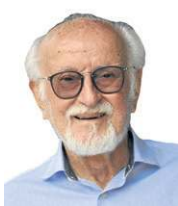
» ALDO PAVIANI Geógrafo e professor emérito da UnB

Já escrevi diversos artigos sobre Brasília e, em alguns deles, defendi a ideia de que todos os núcleos urbanos do Distrito Federal (DF) fazem parte da capital federal. Por isso, o Gama e Sobradinho, assim como todos os outros, somam para que a capital, que poderia ser um só bloco urbano, seja um conjunto de núcleos esparsos/disseminados no território.