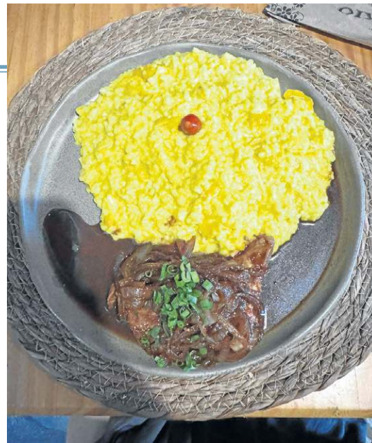
Risoto de pequi com coxa e sobrecoxa de frango desossado grelhado na laranja