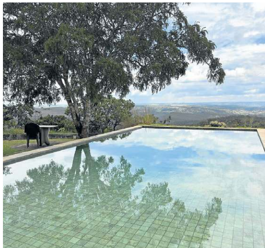
Vista da pousada Villa dos Pireneus

transformou um almoço comum em um daqueles momentos que permanecem na memória da viagem.