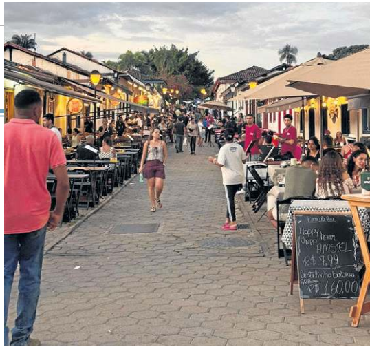
Rua do Lazer atrai visitantes pela vasta opção de restaurantes