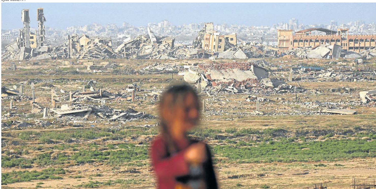
Menina palestina diante de edifícios destruídos em Deir al-Balah, no centro da Faixa de Gaza