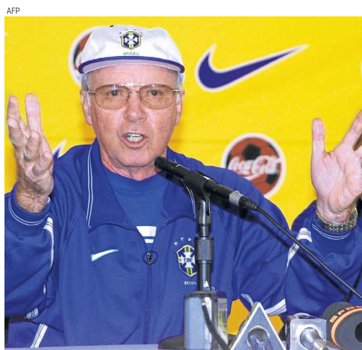
Zagallo anuncia o corte do Baixinho uma semana antes da estreia