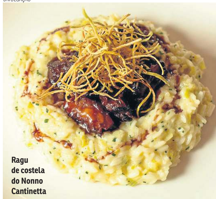
Ragu de costela do Nonno Cantinetta