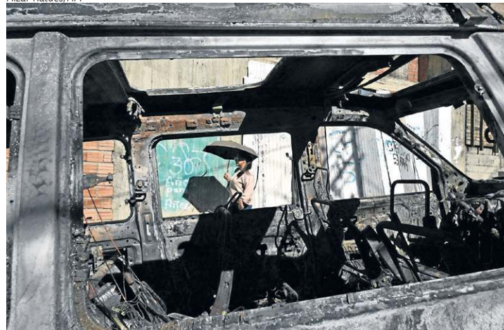
Moradora observa viatura policial incendiada em protesto em La Paz

renovado, em 11 de maio, por suposto tráfico de uma menor de 15 anos, a qual ele engravidou.