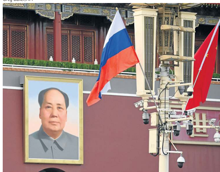
Bandeiras da Rússia e da China diante do retrato de Mao Tsé-tung

da disputa pela influência no mundo”. Embora Xi trate Putin “com toda a deferência e respeito”, o estudioso vê “uma assimetria muito grande” entre os dois, ainda que sejam sócios no Brics. “É a ideia de que está em construção, em marcha uma outra ordem internacional, ou seja,