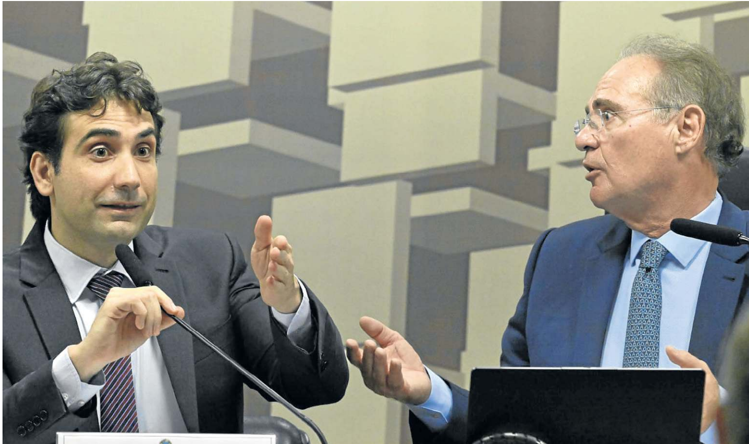
Gabriel Galípulo, do BC e Renan Calheiros, presidente da CAE, discutiram em audiência pública sobre a crise provocada pelo Master

Conhecido pelo perfil tranquilo e sóbrio, mesmo sob pressão, o presidente do Banco Central, Gabriel Galípulo, subiu o tom, ontem, em discussão com o aliado do governo, presidente da Comissão de Assuntos Econômicos (CAE) do Senado, Renan Calheiros (MDB-AL). O senador afirmou que o chefe da autoridade monetária teria defendido a operação de venda do Banco Master ao BRB e teria intercedido para que o Fundo Garantidor de Crédito (FGC) socorresse o banco de Daniel Vorcaro.