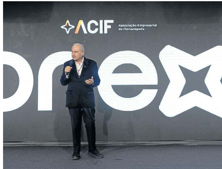
Neto lamentou que o debate sobre jornada ocorra em ano eleitoral

mantendo o mesmo valor de salário, isso não cabe no custo”, disse.