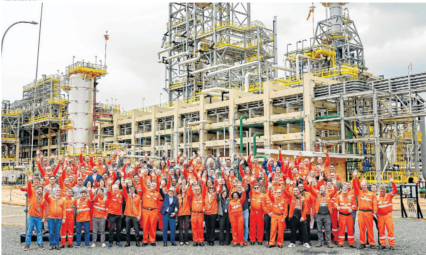
Ao anunciar investimentos de R$ 37 bilhões da estatal em São Paulo, Lula disse que a Petrobras é “patrimônio do povo brasileiro”

A ideia da Petrobras, ao focar nos investimentos da Margem Equatorial, é usar os rendimentos