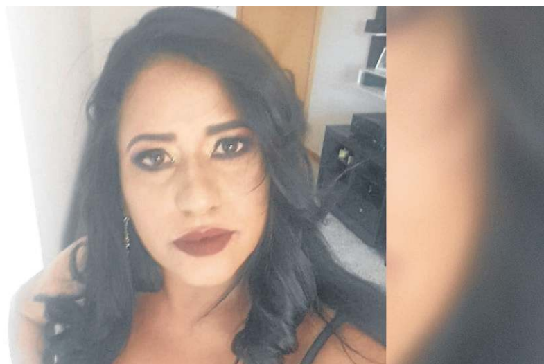
O assassinato ocorreu na manhã de sábado, no Condomínio Mansões Parque Brasília, em São Sebastião