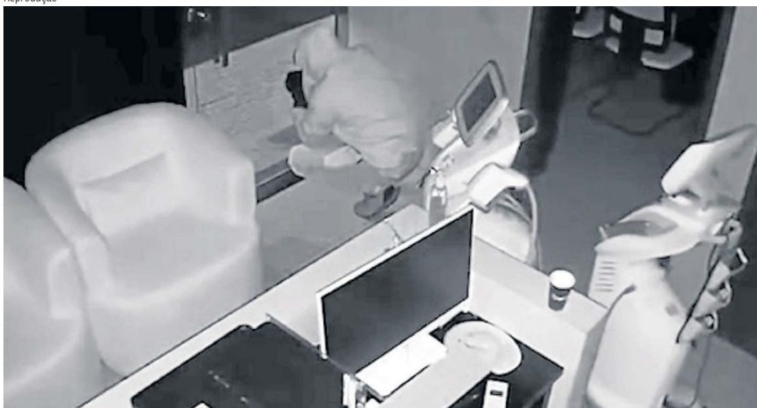
Câmera de segurança flagrou a ação dos criminosos, que durou pouco mais de uma hora

caçamba do automóvel e foram deixados na sala do imóvel. O crime durou pouco mais de uma hora.