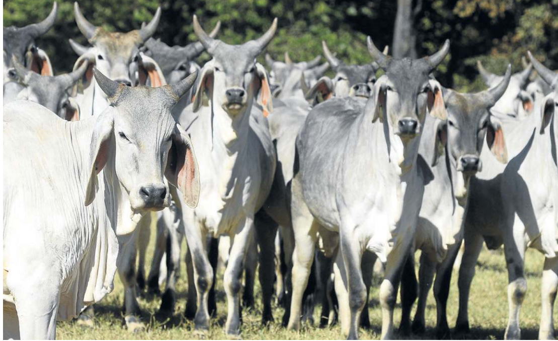
Veto da UE à carne brasileira tem pretexto sanitário, mas ocorre em meio a temor por competitividade